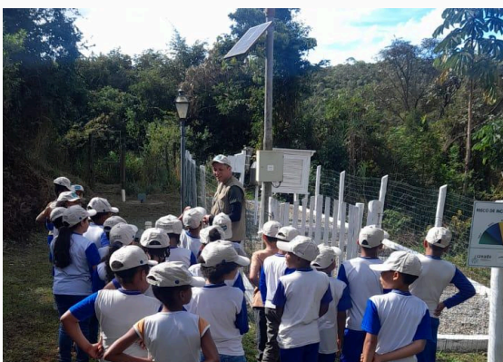
Figura 05: Estação meteorológica Data: 28/05/2025

A próxima parada foi em uma estação meteorológica. Neste ponto, os alunos receberam explicações sobre a função da estação, sua importância para o monitoramento do clima e, especialmente, sua relação com a previsão e o risco de incêndios florestais. Também foram abordadas as ações dos brigadistas em casos de incêndio, destacando a importância do trabalho preventivo e de combate realizado por esses profissionais.