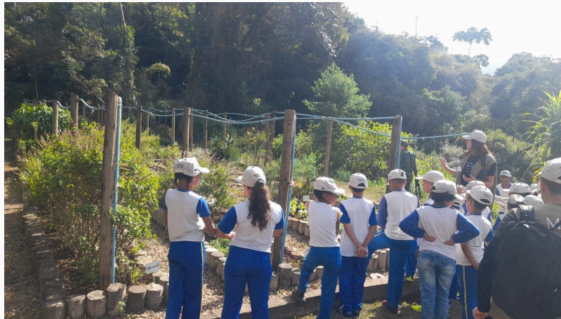
Figura 04: Apresentação da horta de plantas medicinais Autoria: Miliane Neto Data: 28/05/2025

O grupo seguiu para o segundo ponto de parada, que consistia em uma horta de plantas medicinais. Nesse espaço, foram destacadas as plantas medicinais e seus princípios ativos, com explicações sobre os usos terapêuticos mais comuns. As crianças demonstraram grande interesse pelo tema e compartilharam experiências relacionadas, especialmente sobre os chás preparados por suas mães em casa, o que gerou um momento de troca e valorização dos saberes.