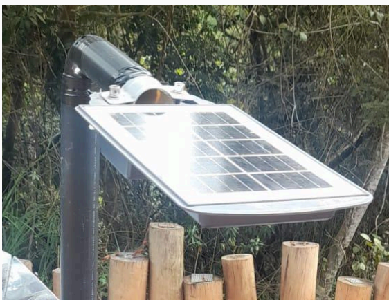
Figura 12: Fonte de energia solar Autoria: Miliane Neto Data: 28/05/2025