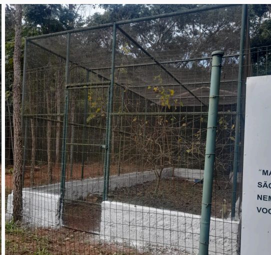
Figura 16 e 17: Explicação do processo e local de reabilitação das aves silvestres Autoria: Miliane Neto Data: 28/05/2025

Após as atividades citadas, ocorreu o reencontro das duas turmas. Esse momento foi marcado por uma apresentação conjunta sobre os resíduos sólidos, abordando a importância da separação correta dos materiais, reciclagem e o tempo de decomposição de diferentes tipos de lixo. Durante essa parada, foram distribuídas frutas e água para as crianças, com o objetivo de repor as energias para a continuidade do percurso. Além disso, esse momento também serviu para observar a forma como as crianças descartam seus resíduos, permitindo avaliar sua percepção e conscientização em relação ao tema trabalhado.