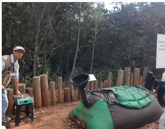
Figura 13: Fonte de energia de biomassa Data: 28/05/2025