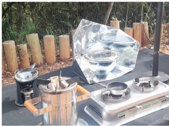
Figura 11: Fonte de energia térmica Data: 28/05/2025