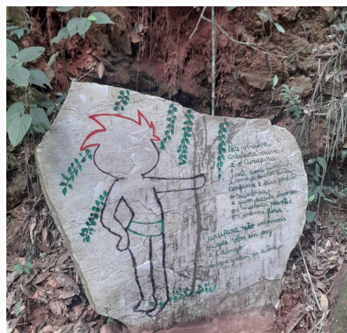
Figura 24: Pedra representando o curupira Autoria: Miliane Neto Data: 28/05/2025

Por fim, caminhou-se até o final da trilha. Ao longo deste percurso, haviam pontos temáticos de curiosidade e reflexão, como por exemplo o curupira, personagem folclórico conhecido por proteger a floresta e seus habitantes.