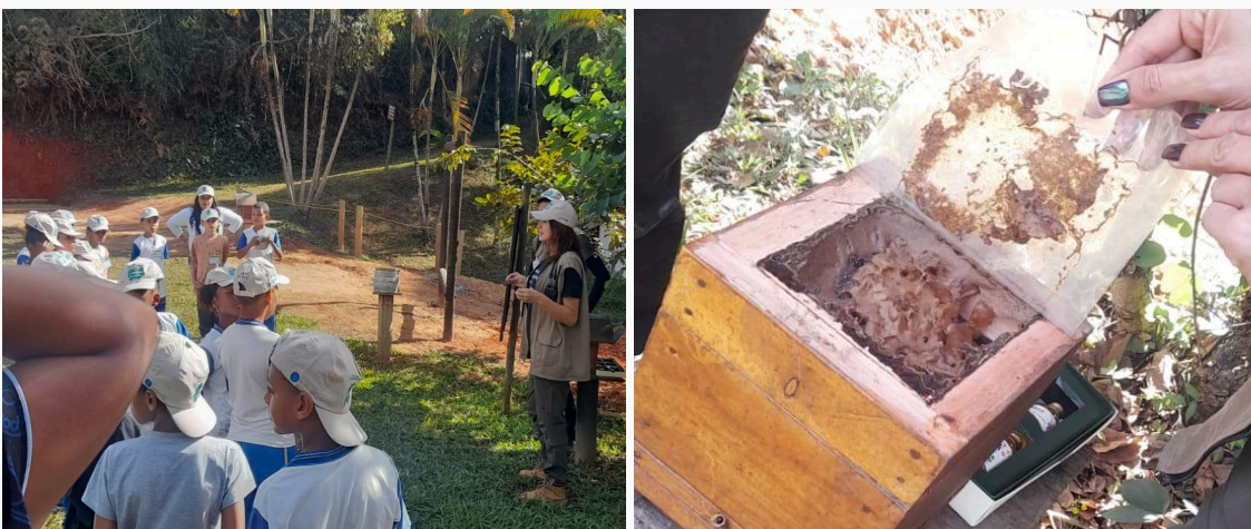
Figura 02 e 03: Apresentação e explicação da colmeia. Data: 28/05/2025

Ao chegar ao primeiro ponto de parada, foi realizada uma apresentação sobre colmeia, destacando a importância das abelhas para a vida no planeta. Foram abordadas informações sobre as espécies de abelhas nativas brasileiras, bem como foram feitas comparações com espécies invasoras, ressaltando suas diferenças.