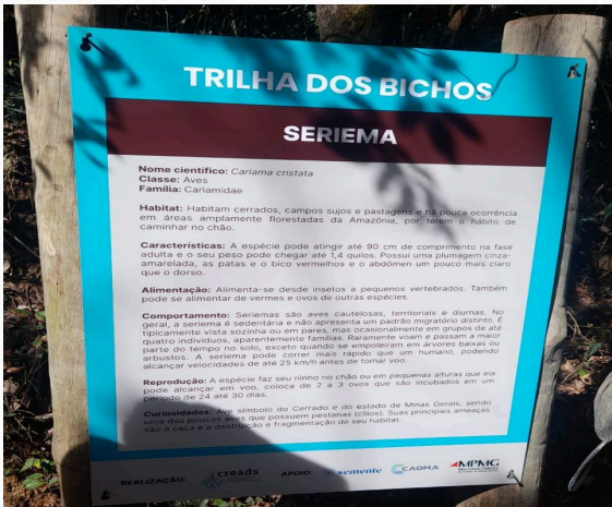
Figura 14: Trilha dos bichos Data: 28/05/2025