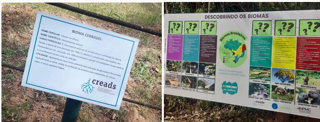
Figura 07 e 08: Placas explicativas dos biomas Autoria: Miliane Neto Data: 28/05/2025