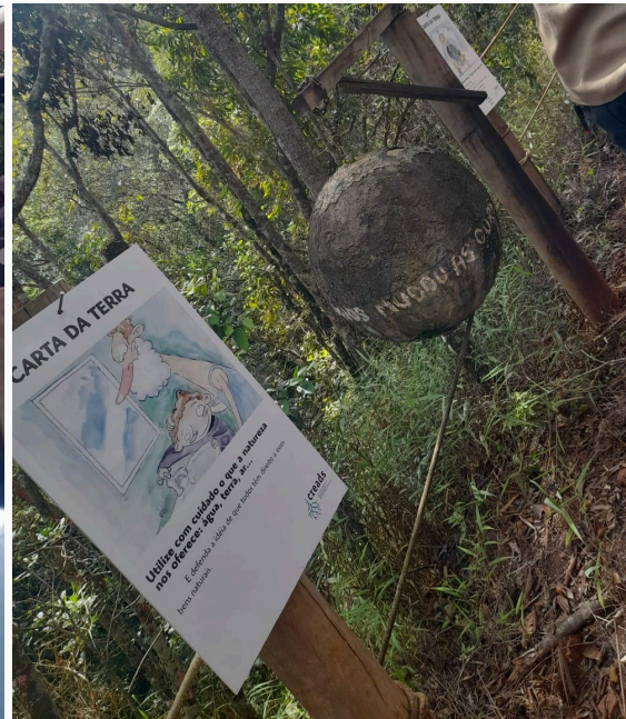
Figura 20 e 21: Momento carta da Terra Autoria: Miliane Neto Data: 28/05/2025