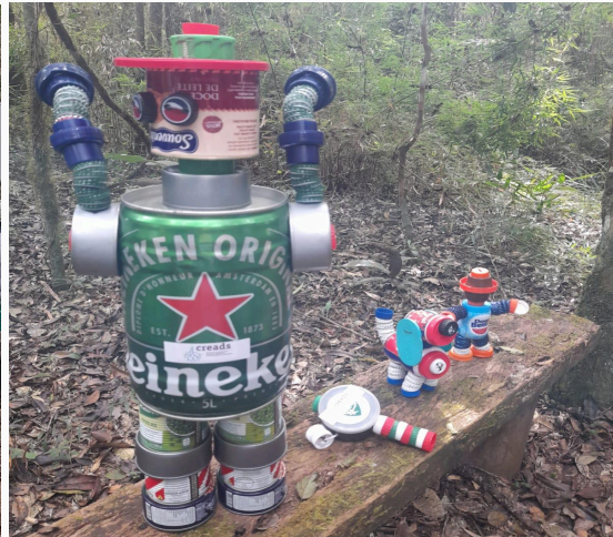
Figura 19: brinquedos feito com recicláveis Data: 28/05/2025

Na sequência, cada grupo deu continuidade ao seu percurso. A primeira atividade dessa etapa foi o momento “Carta da Terra”: atividade voltada à sensibilização sobre a importância do meio ambiente, com reflexões sobre a preservação da água, do ar e do solo. Nesta atividade demonstrou-se o planeta Terra desde sua formação inicial e sua situação atual. Foi ressaltado o impacto das atividades humanas, especialmente na poluição, na degradação do meio ambiente e nas mudanças observadas ao longo do tempo.