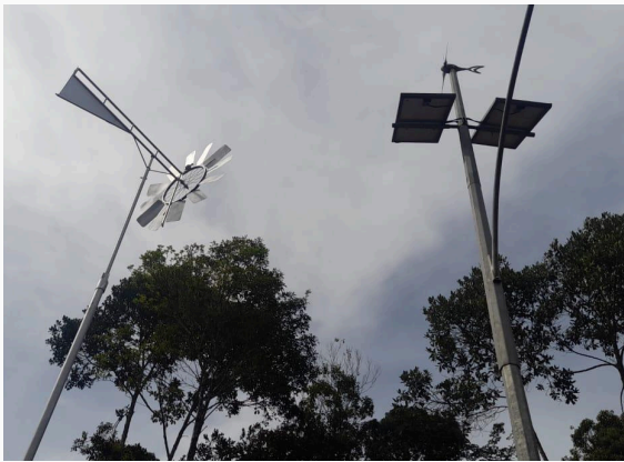
Figura 10: Fonte de energia eólica Data: 28/05/2025