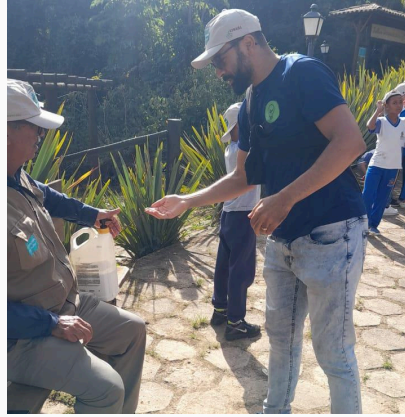
Figura 01: Utilização do protetor solar para início da trilha Autoria: Miliane Neto Data: 28/05/2025

Com todos os participantes preparados, os alunos foram divididos em dois grupos. Cada grupo iniciou a trilha por um ponto diferente, de modo que se encontrariam no meio do percurso e, a partir daí, continuariam em sentidos opostos. O grupo acompanhado pela equipe do Semente iniciou as atividades com o “momento dos sentidos”. Durante o trajeto até o primeiro ponto de parada, um dos acompanhantes responsáveis propôs uma reflexão sobre a importância de aprender a sentir e perceber a natureza ao redor.