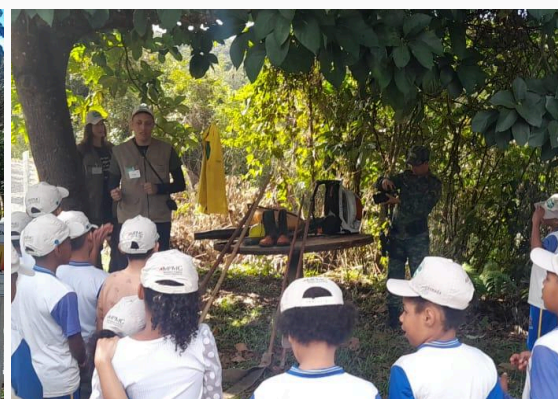
Figura 06: Explicação dos EPI's dos brigadistas Data: 28/05/2025