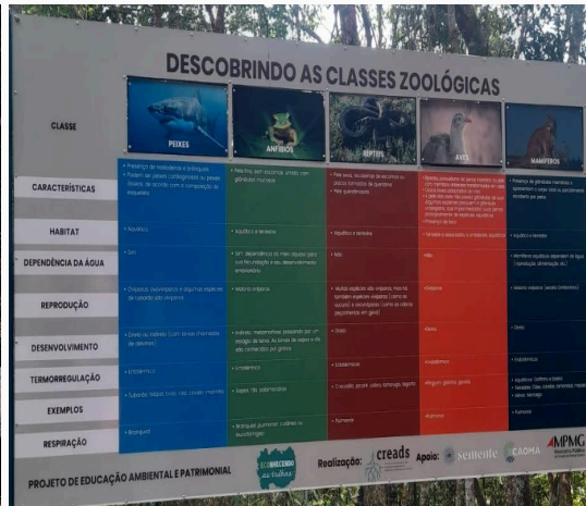
Figura 15: Placa interativa: classes zoológicas Autoria: Miliane Neto Data: 28/05/2025