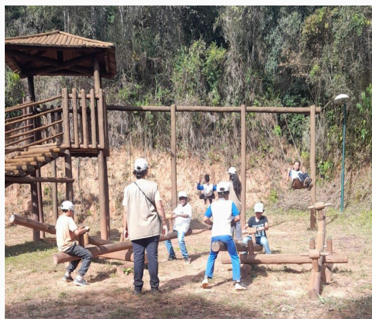
Figura 26: momento livre ao parque Data: 28/05/2025

Para encerrar a visita, todos foram levados ao auditório para o momento de agradecimento, onde receberam um kit contendo lanche, bloco de notas e uma garrafinha como lembrança da experiência.