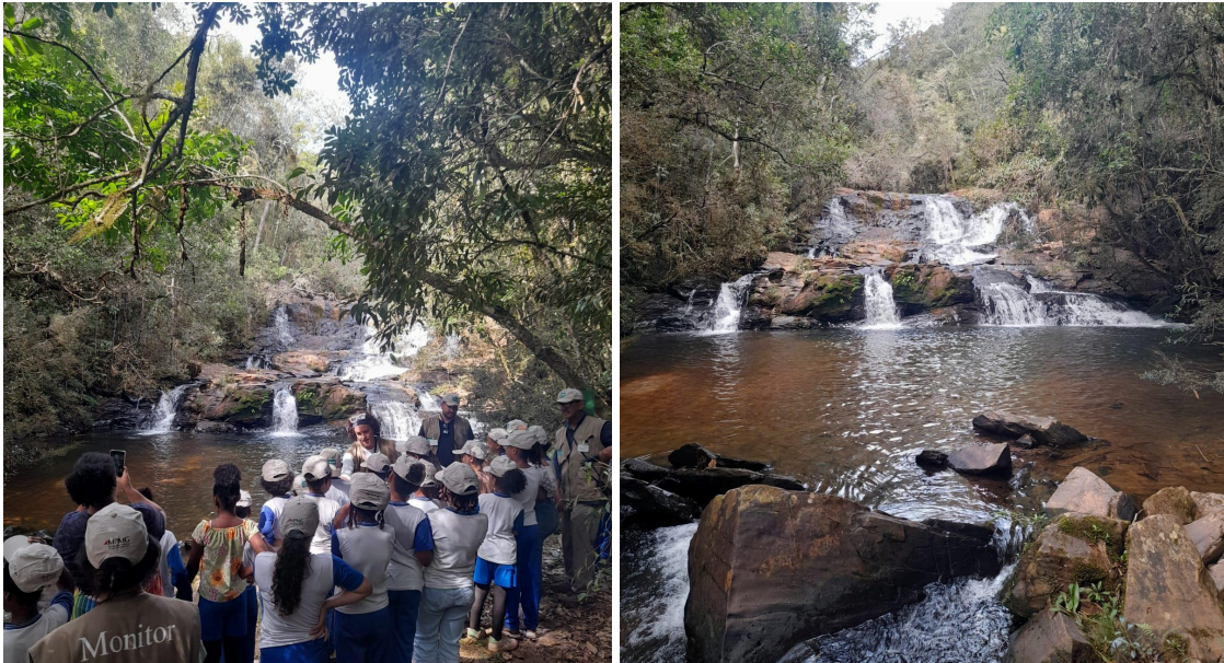
Figura 22 e 23: Apresentação da cachoeira para as crianças Data: 28/05/2025

Logo após, a equipe caminhou até a cachoeira. Nesse local foi destacada a importância da água, evidenciando sua pureza, sendo um dos primeiros afluentes da Bacia dos Rios das Velhas e Paraopeba.