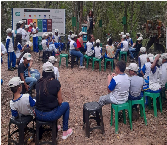
Figura 18: Roda de conversa sobre resíduos Autoria: Miliane Neto Data: 28/05/2025