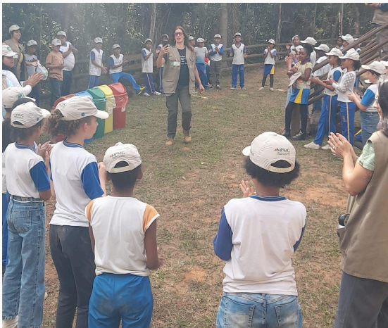
Figura 25: Momento música Creads Data: 28/05/2025